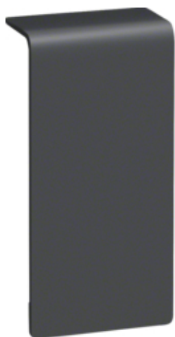
Jonction SL20055 graphite noir