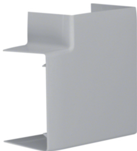
Angle plat LFF60090G